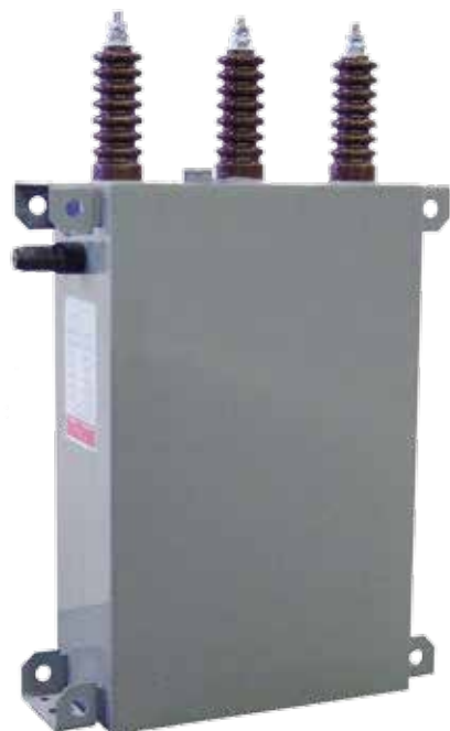
FIG. A2 / РИС. А2

Esempio installazione pressostato Example of pressure switch installation Пример установки реле контроля давления