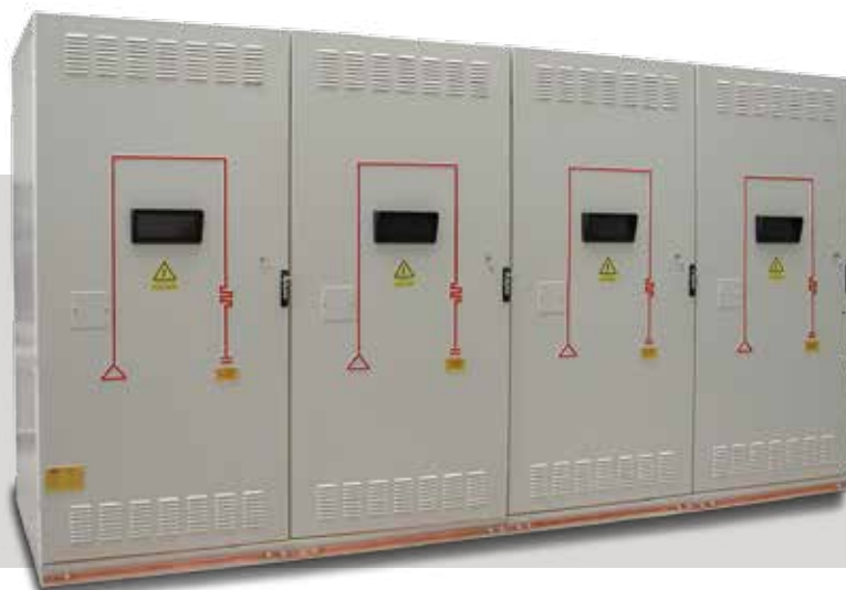
FIG. A37 / РИС. А37

Esempio di realizzazione celle di rifasamento MPFC da 12kV-200+400+400+600 kvar-50 Hz