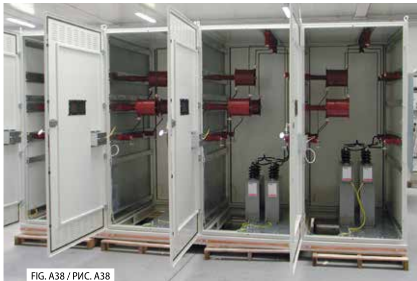
FIG. A38 / РИС. А38