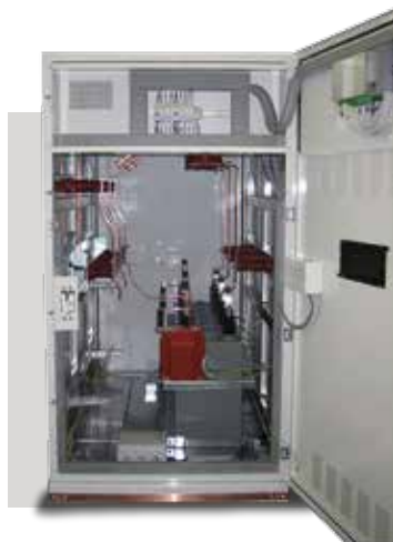
FIG. A39 / РИС. А39

Габаритные размеры модулей для коррекции коэффициента мощности стандартного типа MPFC в отдельном или двойном корпусе.